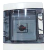
Coffret de protection DC