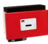
ou onduleur central SMA