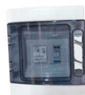
Coffret de protection AC Suivi de production ECU : En option